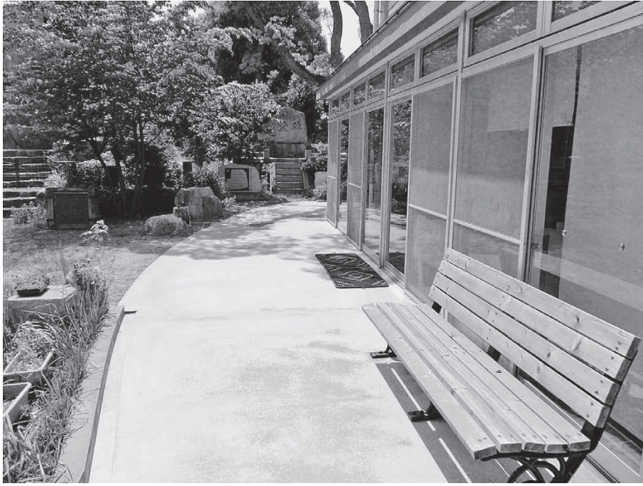
住所・お問い合わせ先等は④面に掲載

魚崎わかばサロンの従来の木製デッキが老朽化してきたため、全面改修いたしました。 新しいデッキはコンクリート製で、段差をできるだけ少なくするなど、庭園への出入りが安全にできるよう工夫されています。