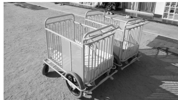
「津波避難カート」1台で6～8人の園児を運ぶことができます。