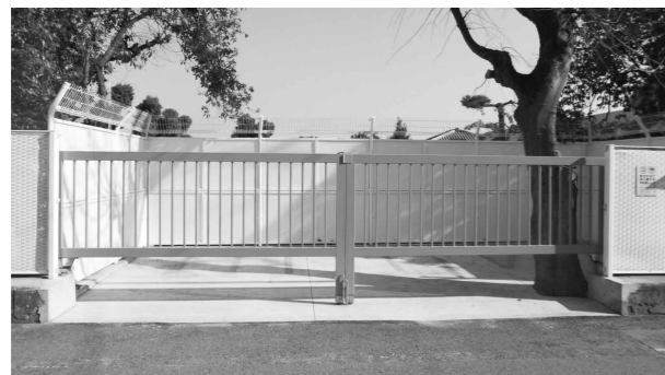
「ママさんスペース」

そこで、魚崎財産区では、魚崎、瀬戸の両保育所に対して、津波発生の際には迅速に園児を安全な場所に避難させるため、避難カートの購入費（それぞれ6台分、計12台分）を助成することを決定いたしました。